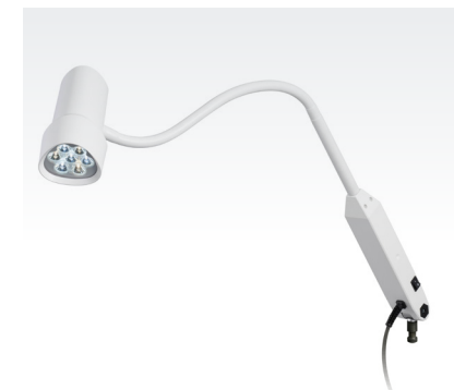
HALUX N50-1 P FX