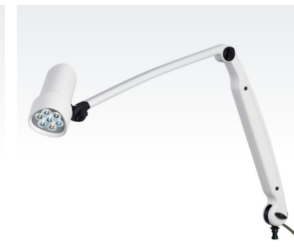
HALUX N50-3 P FX