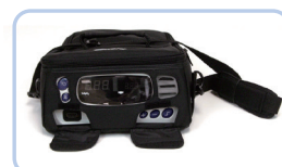
キャリングケース